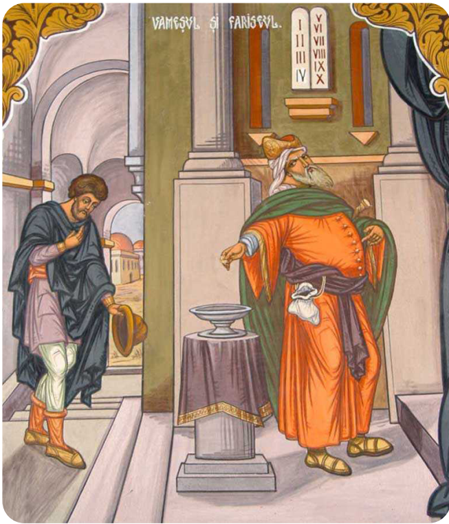
Vameșul și Fariseul

ra, judecătoare fără de omenie, împotriva luptătoare a lui Dumnezeu” (Filocalia, IX, Cuvântul 25, Despre mândrie, București, 1980).