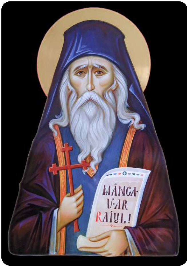
Sfântul Cuvios Ilie Cleopa

ales pentru a crede în Mesia, venea să-L arate lumii pe Hristos și apoi să-L boteze în apele Iordanului.